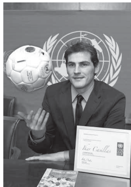
Fotografía: Iker Casillas, arquero del equipo campeón del mundo de fútbol, Embajador de Buena Voluntad de la ONU.

Por eso, Naciones Unidas ha entendido la necesidad de convocar superatletas, y dotarles de la honorífica distinción de ser “Embajadores de Buena Voluntad” así como potenciar los grandes eventos deportivos como plataformas para el interés divulgativo. Aprovechando su imagen, su poder de convocatoria, su manejo de las redes sociales y su compromiso con las causas por los más desfavorecidos, estos embajadores-deportistas se convierten por momentos en “agentes ad-hoc” de la diplomacia multilateral. La ONU cuenta con embajadores internacionales, regionales y nacionales. En la lista (actualizada a mayo de 2013) aparecen como embajadores de buena voluntad algunos de los deportistas más conocidos en el mundo, que prestan su concurso a