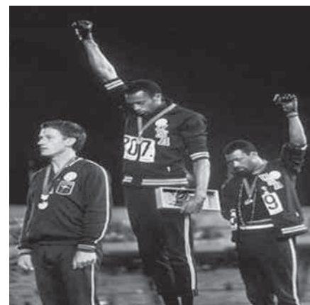
Fotografía: Black Power en los juegos olímpicos de México 1968: Los atletas estadounidenses Carlos y Smith hacen el símbolo del “black power” en el podio de los Juegos Olímpicos de Mexico 1968 en protesta por el racismo en el mundo.

en el deporte de la exestrella de la NBA John Amaeichi; la defensa del islam en Francia del futbolista del equipo nacional galo Liliam Thuram; la campaña abierta a favor del presidente Barack Obama por la estrella de la NBA LeBron James; o aquella férrea posición del futbolista Carlos Caszely en contra del dictador Pinochet. También podemos traer historias de íconos del deporte como Mohammed Alí, quien rechazó dentro y fuera de los cuadriláteros estadounidenses la participación de su país en la guerra de Vietnam; o cómo olvidar las imágenes del famoso símbolo “black power” hecho con los puños en alto por los atletas de Estados Unidos John Carlos y Tommie Smith en el podio de los Juegos Olímpicos de México 1968 protestando por la discriminación racial.