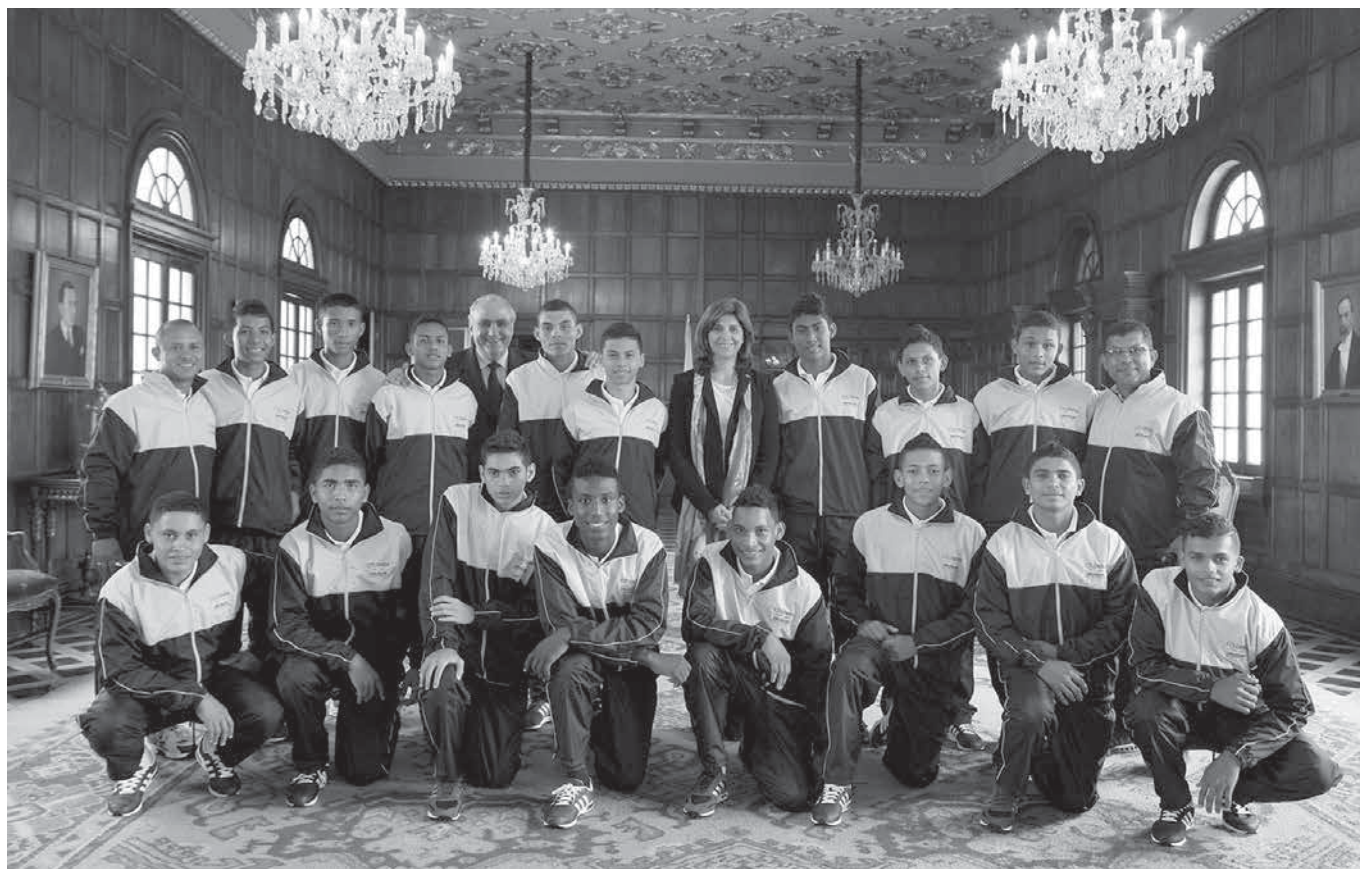
Fotografía: La Ministra María Ángela Holguín y el grupo de jóvenes de Carmen de Bolívar representantes de Colombia en la 1 Copa de Programas Sociales en Uruguay. 13 de marzo 2014

De acuerdo con la Dirección de Asuntos Culturales de Cancillería,