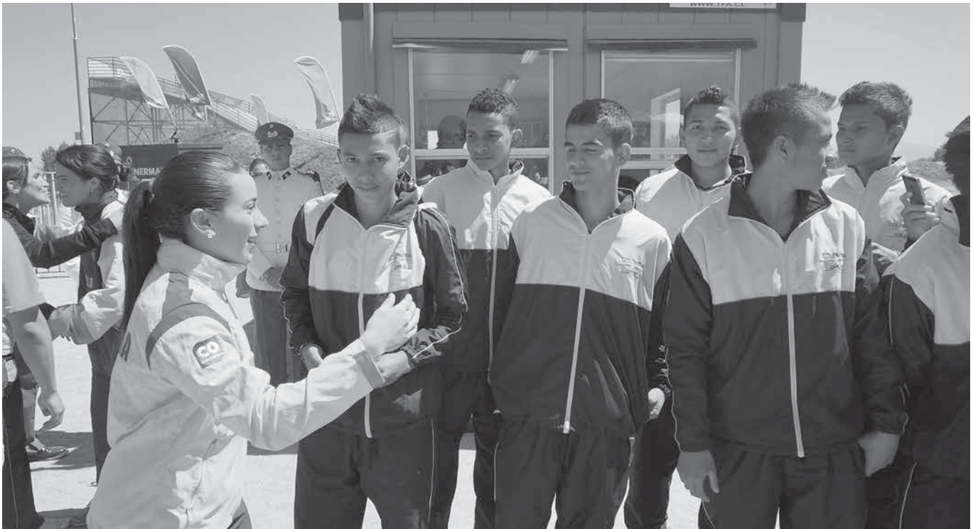
Fotografía: Mariana Pajón, medalla de oro olímpica en BMX en los Juegos Olímpicos de Londres 2012, conversa y alienta a los jóvenes deportistas de Puerto Leguizamo. 9 de marzo de 2014