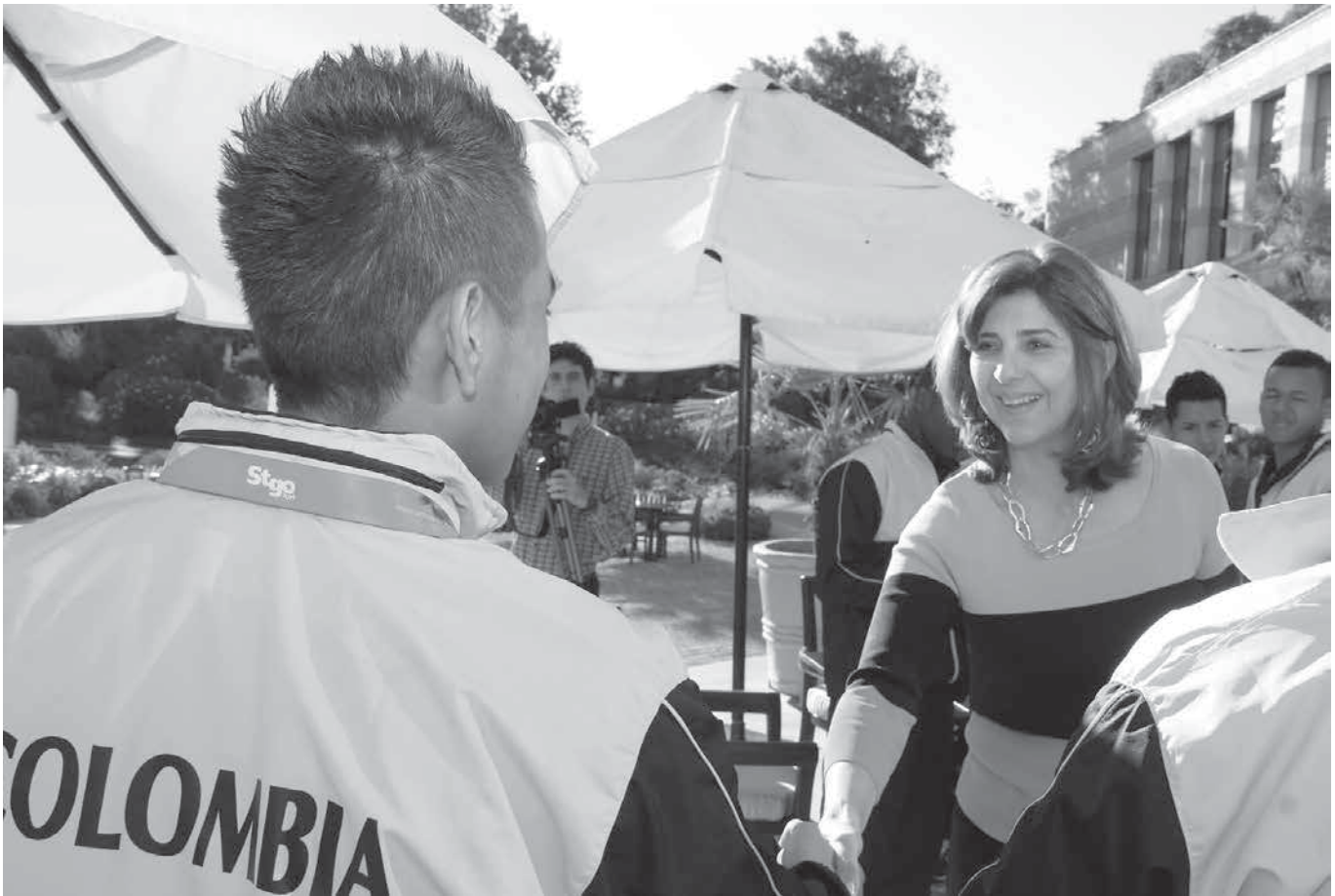
Fotografía: La ministra María Ángela Holguín despide a una delegación deportiva. La Diplomacia Deportiva es una iniciativa que ha impulsado la Cancillería desde 2011.

años” 13 . Agradamos con esperanza la escalada de esta cifra.