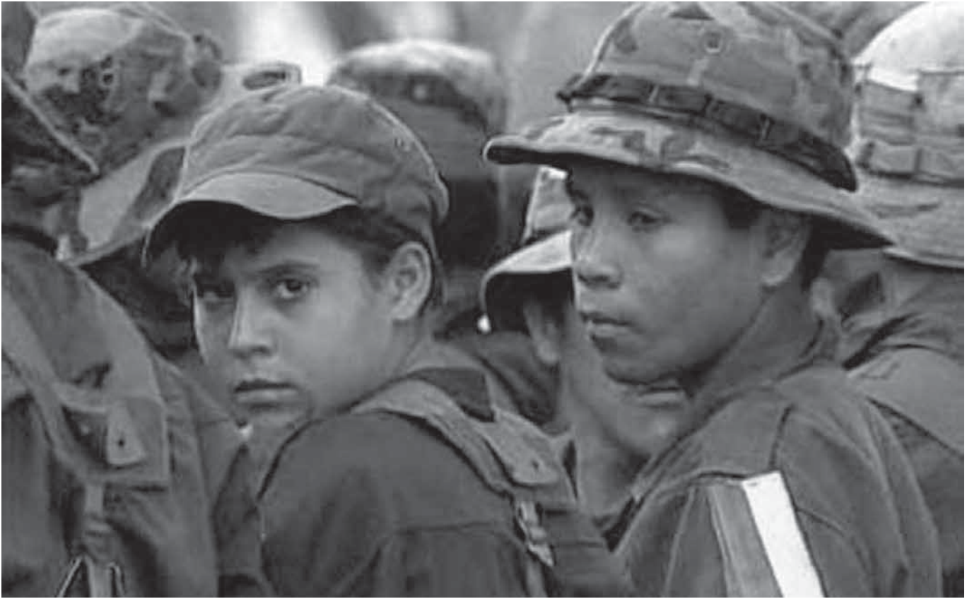
Fotografía: Niños combatientes de las Farc por reclutamiento forzado: una imagen que no queremos ver repetida.

Gali recibió un informe relativo al impacto de los conflictos armados en los niños del mundo. Esto condujo a que la Asamblea General recomendara el nombramiento de un Representante Especial para hacer el seguimiento del tema, y sumado a un interés paralelo del Consejo de Seguridad, materializó su entrada en la agenda del Consejo. Bajo los parámetros de la Resolución 1261 de 1999 –que vinculó la promoción de la paz con los derechos de los niños–, el Consejo de Seguridad solicitó al Secretario General el inicio de la presentación de informes periódicos sobre el tema.