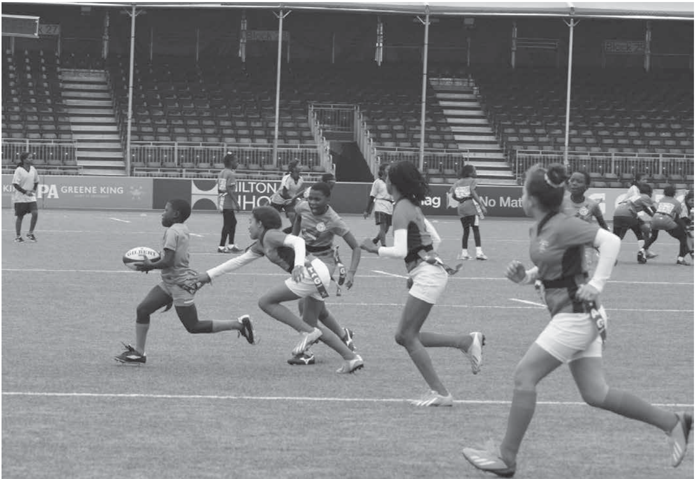
Fotografía: Rugby en el Reino Unido: Niñas cordobesas en intercambio de rugby en el Reino Unido Septiembre de 2013