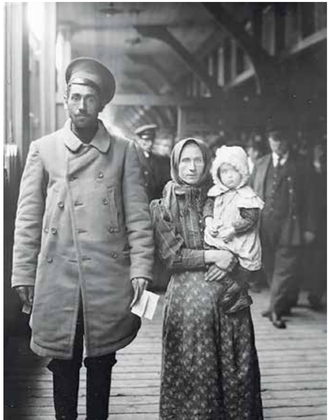
Migrantes holandeses en Canadá, 1911. Fotografía: William James Topley. Library and Archives Canada, PA-010256.

al surgimiento de situaciones políticas internas, fue expedida la Ley de Inmigración de 1919, con la cual se prohibió el ingreso de determinados grupos, como los menonitas, comunistas, austriacos, húngaros y turcos, entre otros. Estas políticas restrictivas se mantuvieron hasta mediados del siglo XX.