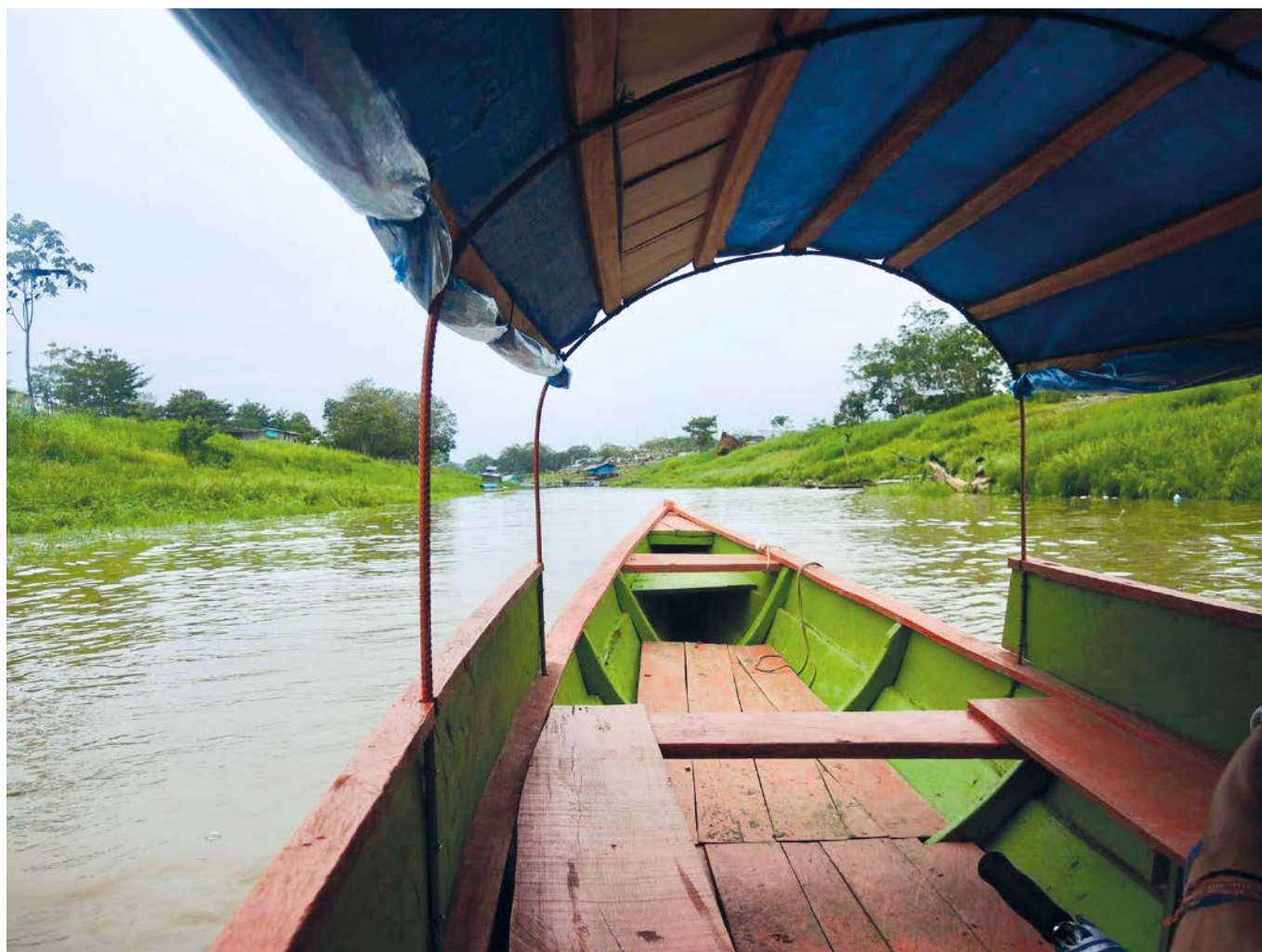
Transporte fluvial, Rio Amazonas, 2014.

locales, etc., con el fin de actuar como entidades independientes encargadas de la toma de decisiones en el ámbito supranacional.