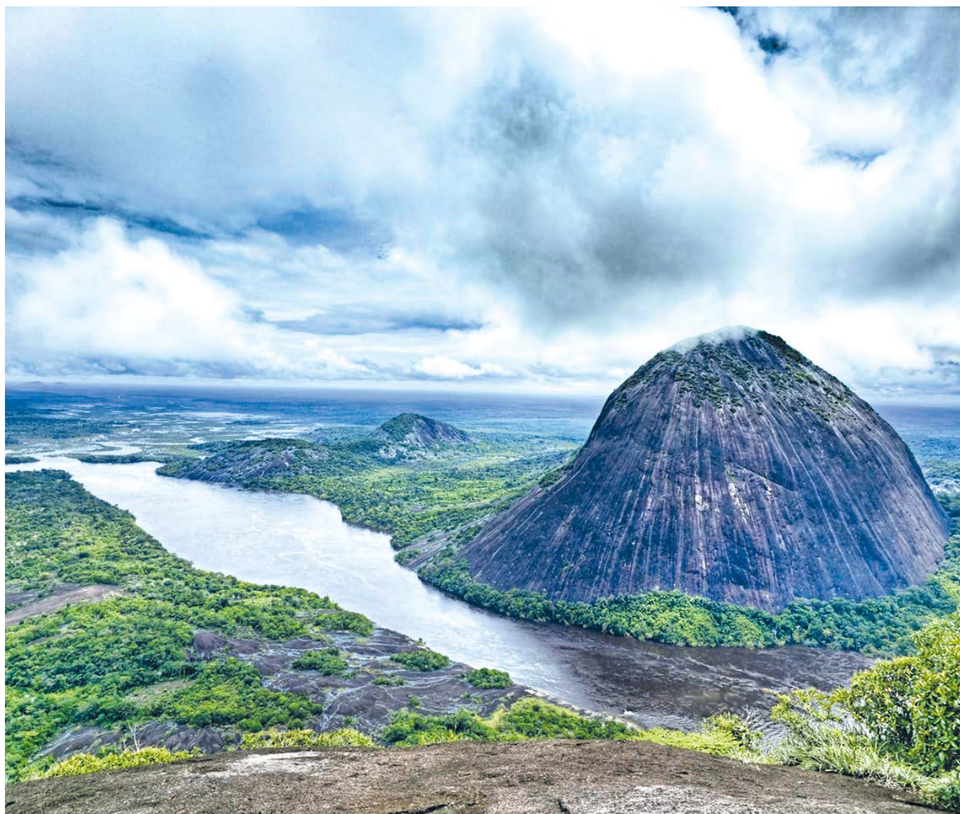
“Duermevela”. Uno de los cerros de Maicuriven o Mavecure. Parte del Escudo de Guayana ubicado en el departamento de Guainía, sobre el río Inírida, cerca de la frontera con Venezuela. 21 de julio de 2024.

de decisión. Las más importantes son la Reunión de Ministros de Relaciones Exteriores de los países miembro, que cuenta con el apoyo y soporte del Consejo de Cooperación Amazónica (CCA) y de la Comisión de Coordinación del Consejo de Cooperación Amazónica (CCOOR). Dicho lo anterior, observaremos los principales aspectos del modelo intergubernamental y supranacional para entrever un modelo