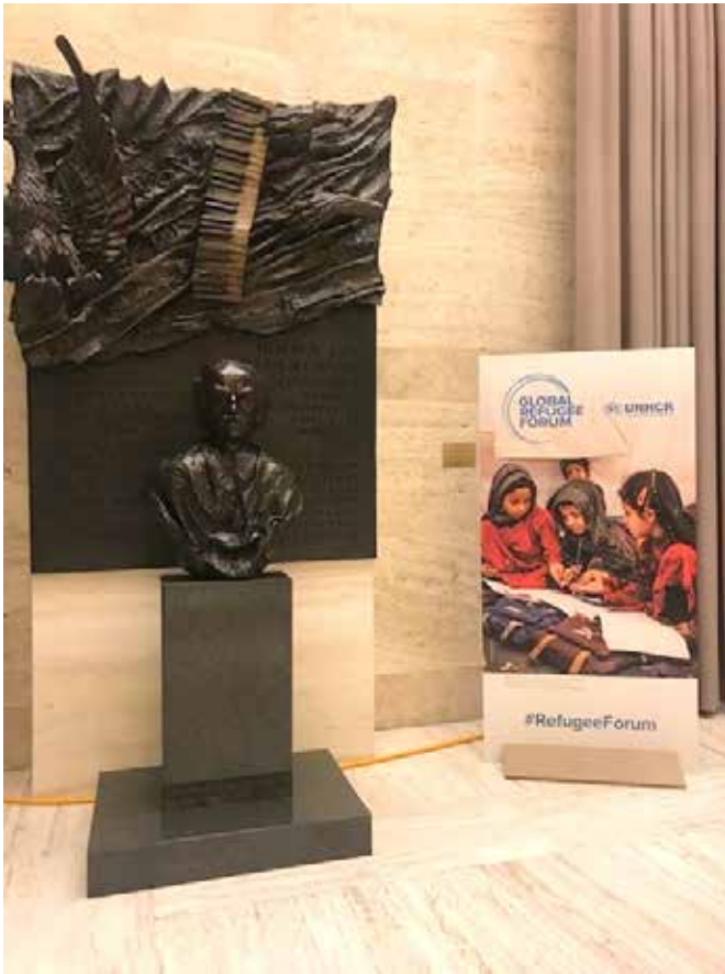
Foro global para refugiados, 17 de diciembre de 2019. Ginebra, Suiza.

como entidad encargada del registro civil en Colombia. Dentro de las disposiciones para dicho protocolo se sugieren las siguientes: