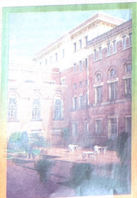
Patio de Banderas, por: Rafael Quintero Cubides. Ministerio de Relaciones Exteriores

En julio de 2001 el Consejo de Seguridad mediante Resolución 1363 creó un Grupo de Vigilancia sobre Afganistán junto con un Grupo de Apoyo. Ocurren posteriormente los graves atentados del 11 de septiembre de 2001 en Estados Unidos, de los cuales se sindicó a Al Qaeda. Un día después de los ataques terroristas el Consejo de Seguridad aprobó la Resolución 1368 (2001) que "Condena inequívocamente en los términos más enérgicos los horrendos ataques terroristas que tuvieron lugar el 11 de septiembre de 2001 en Nueva York, Washington, D.C. y Pennsylvania, y considera que esos actos, al igual que cualquier acto de terrorismo internacional, constituyen una amenaza para la paz y la seguridad internacionales.