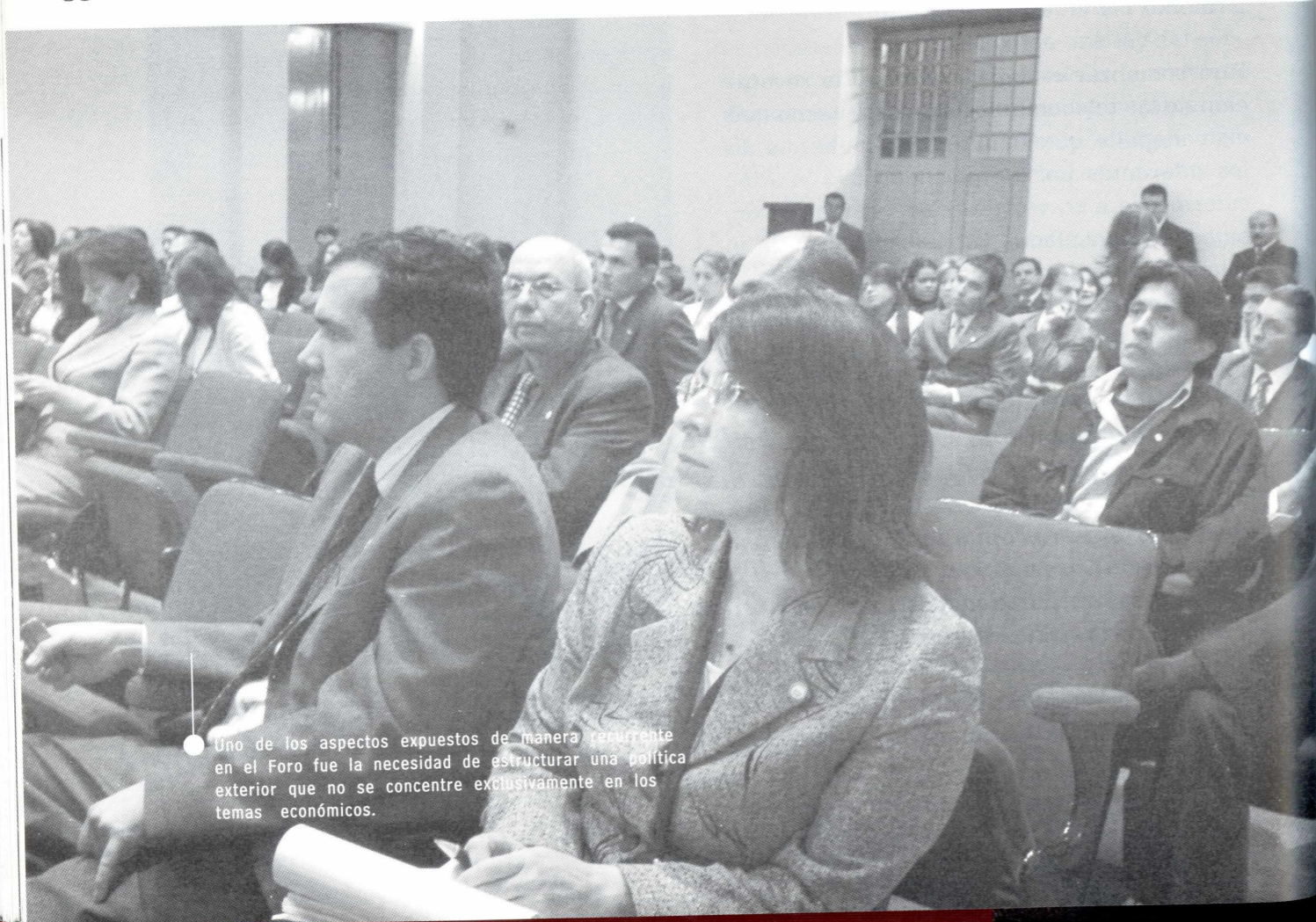
Uno de los aspectos expuestos de manera recurrente en el Foro fue la necesidad de estructurar una política exterior que no se concentre exclusivamente en los temas económicos.

Finalmente, siguiendo la misma línea del debate que propuso desde el principio de su exposición, manifestó: "Yo, desde el punto de vista práctico, desde el punto de vista general de la política, por supuesto aspiraría a que el número de nombramientos políticos fuera o tuviera una proporción bastante inferior a la que tiene hoy en día, pero al mismo tiempo, me parece que los argumentos de la gente que defiende el servicio de Carrera son débiles (...)"