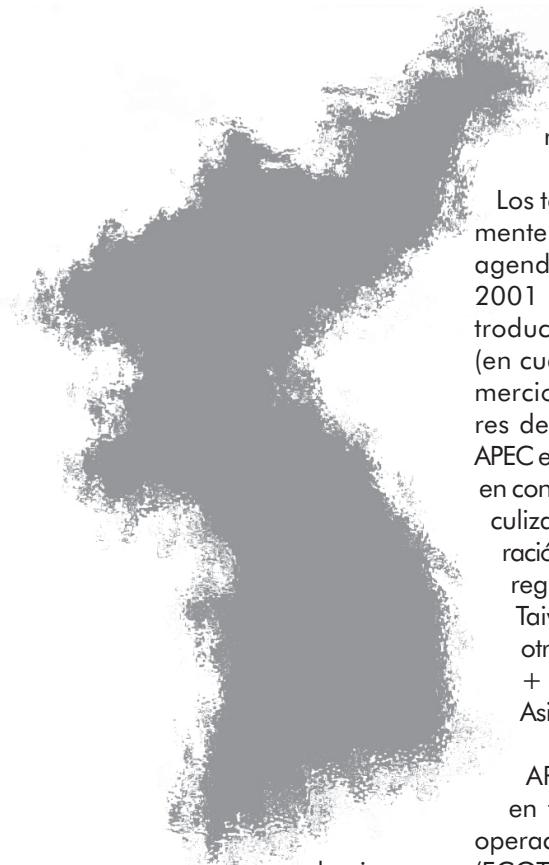
la inversión en la región del Asia Pacífico.

es que cada economía es libre de abordar la manera de cumplir con su respectiva meta.